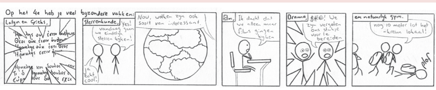
Remus van der Vossen (klas 4)